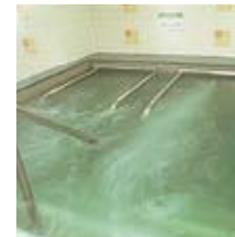
ハイパージェットバス