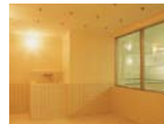
ミストサウナ(男性)