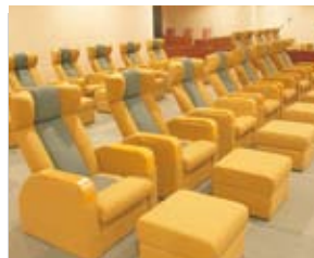
■リラクゼーションルーム