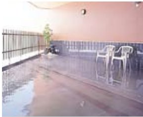
■露天風呂 (天然温泉) ※