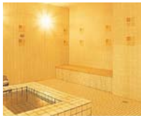
■スチームルーム (女性) ミストルーム (男性)