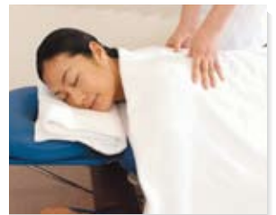
■マッサージ (10分1,050円税込〜)