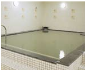
■白湯 (天然温泉) ※