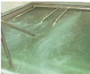
■ハイパージェットバス