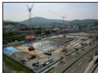
平成23年5月(基礎躯体・1階床躯体)