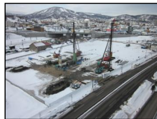
平成24年2月(山留工事・杭打設準備)