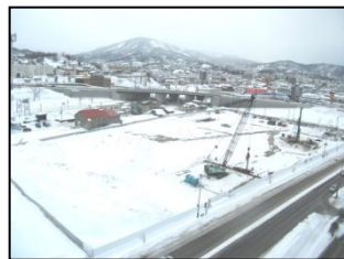
平成24年1月(仮設工事)