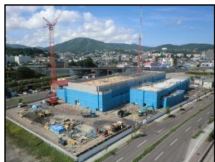
平成24年8月(3階立上・4階床躯体)