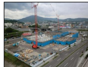
平成24年7月(2階立上・3階床躯体)