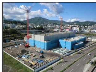
平成24年9月(4階立上・5階床躯体)