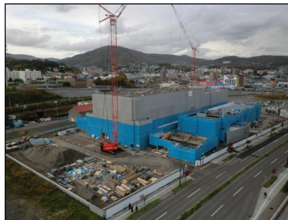
平成24年10月(5階立上・R階躯体)