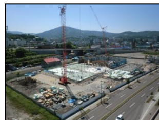
平成24年6月(1階立上・2階床躯体)